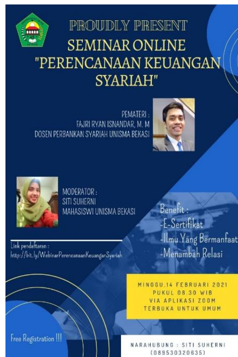
Gambar 1. Pamflet Seminar online tentang perencanaan keuangan syariah