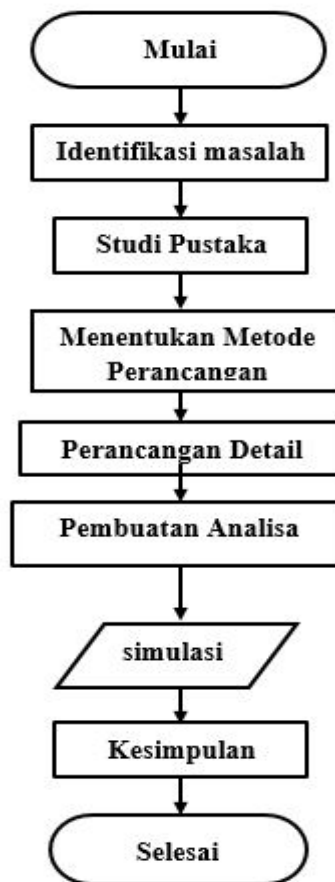
Gambar 1. Diagram Alir

Gambar 1. merupakan diagram alir penelitian yang dilakukan, dengan tahapan sebagai berikut: