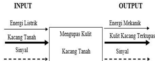
Gambar 2. Struktur Fungsi

Struktur fungsi berdasarkan hubungan antara input dan output berupa aliran energi terlihat pada Gambar 2 dan 3, material dan sinyal dari suatu sistem teknik yang akan menjalankan “Mesin Pengupas Kulit Kacang Tanah”